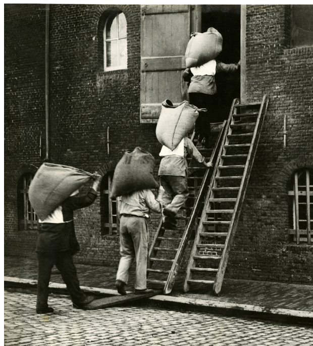
Zakkendragers brengengraan een mouterij in. (Beeldnummer 07123)