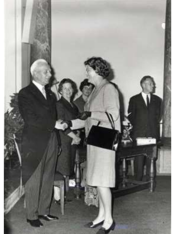
beeldnr. 10711

Wethouder van Onderwijs en Cultuur, ontving in 2011 de Aleidapenning vanwege haar verdiensten voor kunst en cultuur.