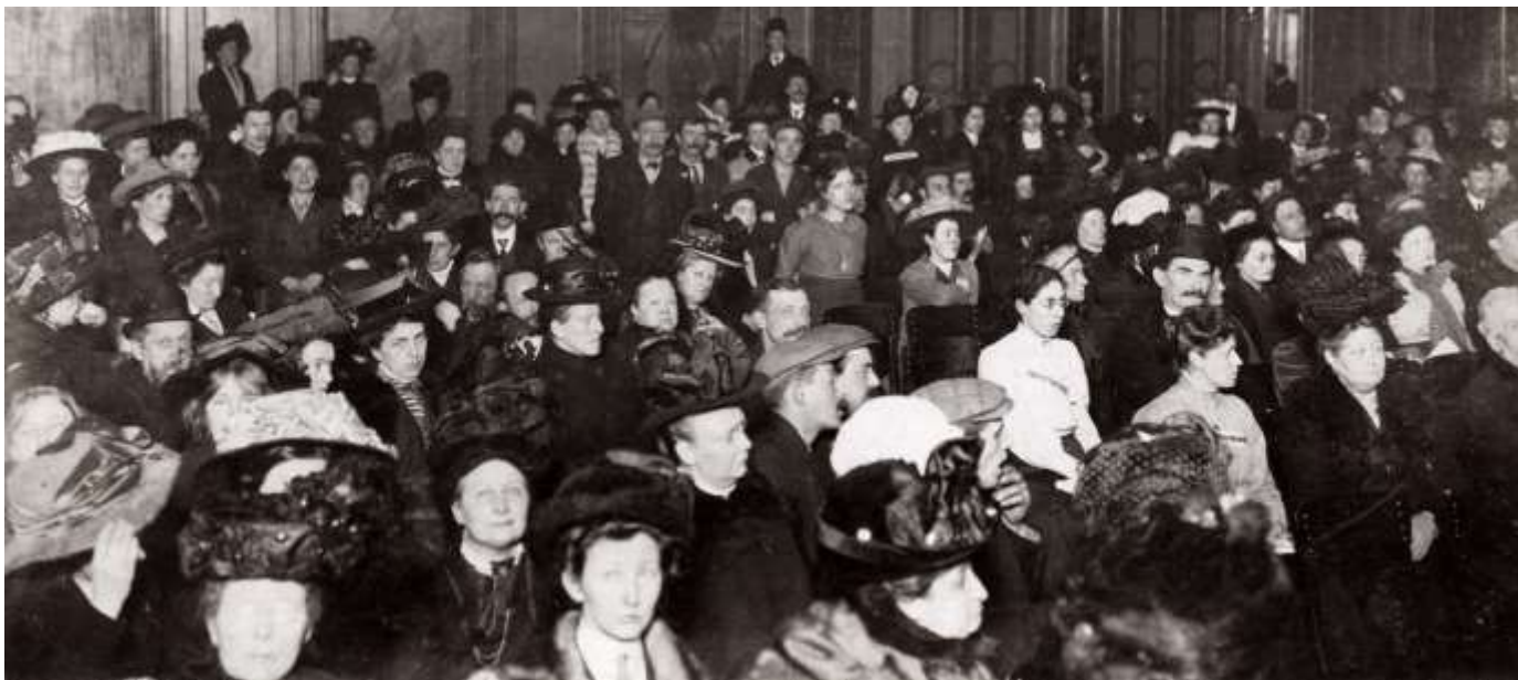
Collectie Het geheugen van Nederland