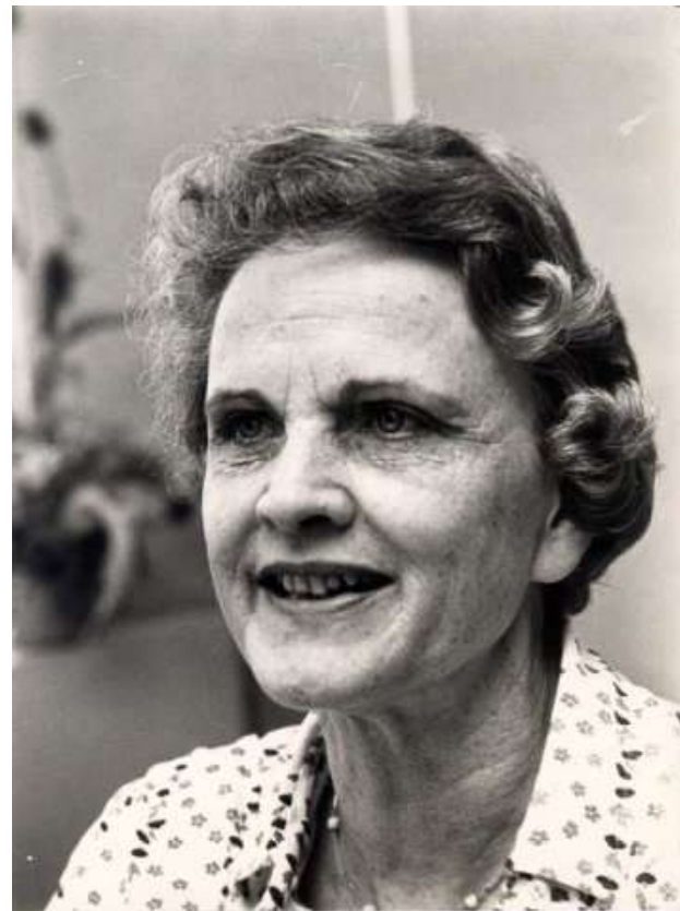
beeldnr. 20060

Zij was in 1978 nummer 1 op de kieslijst van het CDA.