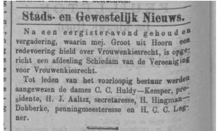
Nieuwe Schiedamsche Courant , 23 april 1909