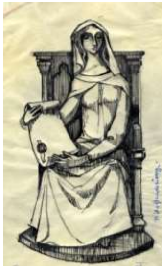
Maker: F. Henderickx, beeldnr. 61318

... een vrouw: Vrouwe Aleida, grondlegger van Schiedam.