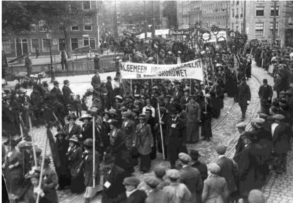
Collectie Het geheugen van Nederland