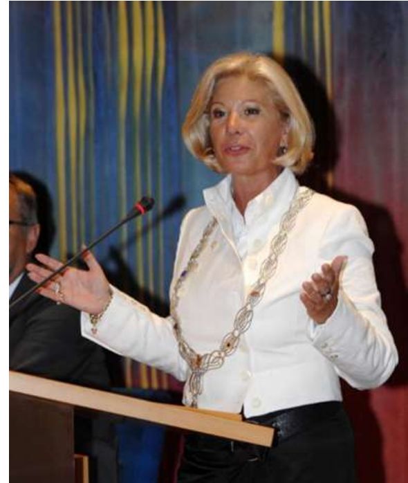
beeldnr. 35950