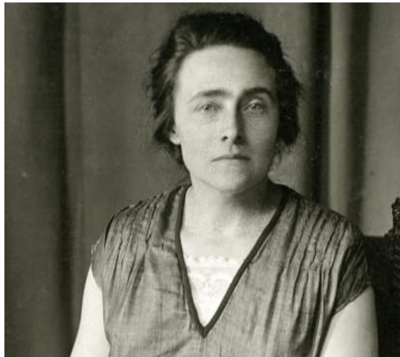
beeldnr. 11347