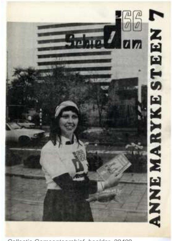
beeldnr. 39409

Zij streed in 1980 voor meer vrouwelijke ambtenaren. Haar motie om bij gelijke geschiktheid een vrouw voorrang te geven, kreeg steun van wethouder Riet Taverne.