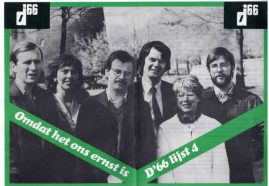
Collectie Gemeentearchief, Beeldnr. 39410

“Vóór het volk, door het College van B&W” was haar leus.