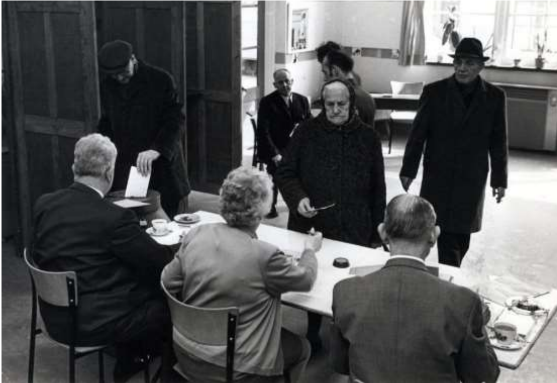
beeldnr. 28447