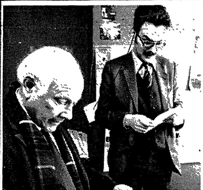
Juist voor het verstrijken van de deadline leverde Joop den Uyl persoonlijk zijn kopij in.