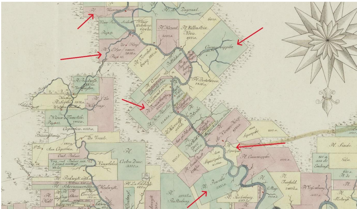
Figuur 2 De bovenloop van de rivier Commewijne met o.m. (van boven naar beneden) de plantages Vlambenburg, L'Esperance, Cramawipibo, Buijnsburg, Siparipabo en Penoribo.

Zorg en Hoop aan de benedenloop van de Commewijne was de eerste plantage die Samuel Paulus Pichot als enig eigenaar verwierf. De toen nog ongecultiveerde grond werd in 1745 aan hem uitgegeven. 29 Vervolgens moet hij in rap tempo de nodige mensen zijn gaan aankopen, ongetwijfeld vrijwel allen Afrikaanse nieuwkomers. In 1744 had hij nog opgave gedaan van slechts 11 personen: behalve hem en zijn echtgenote, 9 mensen in de slavenstand, van wie een beneden de 12 jaar. Dit zal allemaal huispersoneel geweest zijn. In 1752 gaf hij naast zijn gezin en nog een vrije volwassene (vermoedelijk de directeur van zijn plantage), 94 mensen in de slavenstand op, 14 van hen beneden de 12 jaar. 30 Van hen zullen er al gauw rond de 80 op Zorg en Hoop tewerkgesteld zijn geweest. Op de onderneming werd koffie, cacao en katoen geteeld. Volgens de inventaris en taxatie opgemaakt na Pichots overlijden in 1763 telde Zorg en Hoop toen 61 onvrije bewoners: 22 mannen, 23 vrouwen, 4 jongens en 12 meisjes. De plantage werd gewaardeerd op 68.128 gulden en 10 stuivers. 31 In 1765 machtigde Pichots zoon en enige erfgenaam Daniel François Pichot voor een Schiedamse notaris iemand in Suriname om Zorg en Hoop voor hem aan de meestbiedende te verkopen. Twee jaar later had de plantage een andere eigenaar. 32