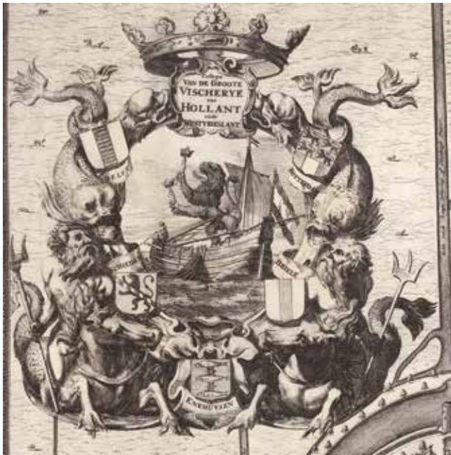
Afb. 2 Het embleem van het College van de Grote Visserij met de wapens van de steden Delft, Rotterdam, Schiedam, Den Briel en centraal onderaan Enkhuizen. In het midden een haringbuis met de Hollandse leeuw met twee gekroonde haringen. Tekening: collectie Archief Delft.

eeuw een grote bloeiperiode door, wat grotendeels te danken was aan de haringvisserij. Door de uitvinding van het haringkaken, de ontwikkeling van de haringbuis (het vissersvaartuig waarmee men op de haringvangst ging) en de toepassing van grote haringnetten was het mogelijk de haring verder op de Noordzee te vangen. Deze visserij werd de Grote Visserij genoemd. In 1566 of 1567 werd het College van de Grote Visserij opgericht, bestaande uit de steden Den Briel, Delft, Rotterdam en Schiedam namens het Zuiderkwartier en Enkhuizen namens het Noorderkwartier (afb. 2). Hoewel verschillende andere steden hebben gepoogd zitting in het college te krijgen, bleven de initiatiefnemende steden de dienst uitmaken.