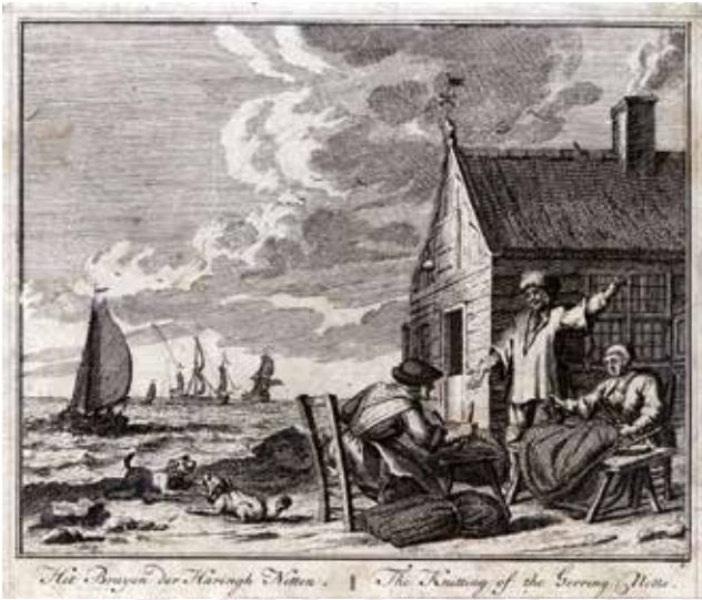
Afb. 5 Gravure met uitbeelding van het breien van haringnetten. Tekening: Adolf van der Laan (1720, collectie Fries Scheepvaartmuseum).