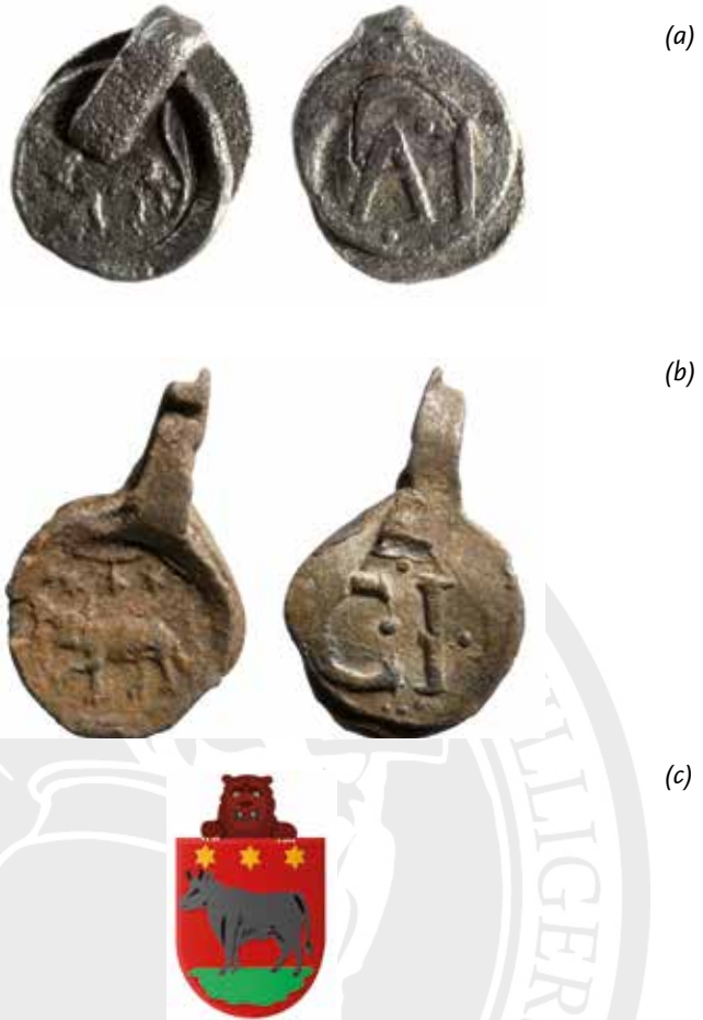
Afb. 13 Keurloden uit Edam met op de voorzijde het stadswapen (koe met drie sterren), diameter 16 tot 17 mm. En met op de achterzijde de initialen AI, opgraving Paktuinen in Enkhuizen in 2014 (1); de initialen CI, waarneming in Stede Broec in 2013 (2) en het wapen van Edam (3).

Het is dus geen toeval dat juist in Enkhuizen veel keurloden voor haringnetten uit diverse steden worden aangetroffen. Momenteel zijn loodjes uit