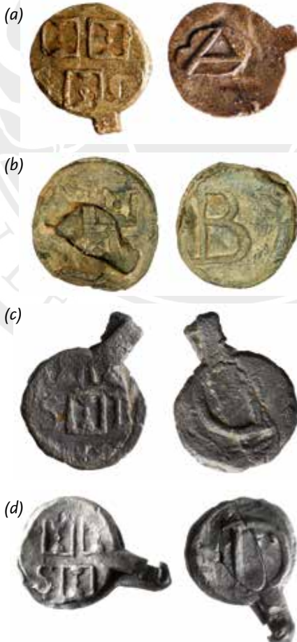
Afb. 6 Keurloden uit Schiedam met op de voorzijde drie zandlopers en de letters SD en op de achterzijde de letters van de keurmeesters, diameter 18 tot 25 mm. Letter A, opgraving Vijzelstraat in Enkhuizen in 2011 (a); letter B, opgraving De Baan in Enkhuizen in 2005 (b); letter C, opgraving Albert Heijn in Enkhuizen in 2013 (c) en letter D, opgraving Paktuinen in Enkhuizen in 2013 (d).

richt waar de keuring plaatsvond en tevens netten werden gebreid en geboet. 7