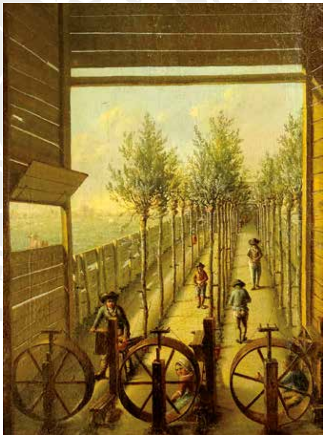
Afb. 4 Schilderij van een kleingarenbaan in Gouda. Schilderij: Joris Herst (1795, collectie Museum Gouda).