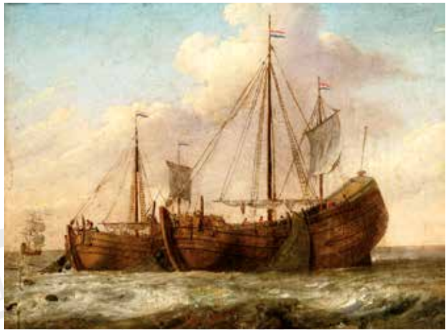
Afb. 3 Twee haringbuizen, geschilderd op een uithangbord uit de 18e eeuw. Schilderij: anoniem (collectie Rijksmuseum Amsterdam).

Aangezien het vervaardigen van netten een typische vrouwentak was, werden in Schiedam als keurmeester ook vooral vrouwen aangesteld. 6 Ze ontvingen volgens de keur uit 1565 voor ieder gekeurd net twee penning als betaling. Na 1650 werd in de kelders van het stadhuis een zogenoemd telhuis inge-