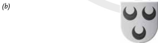
Afb. 10 Keurlood uit de Krimpenerwaard met op de voorzijde het stadswapen (drie halve manen) en op de achterzijde een letter, diameter 18 mm, opgraving Burgwal in Enkhuizen in 2014. Het loodje is mogelijk toe te schrijven aan Krimpen aan de Lek (a) en het wapen van Krimpen aan de Lek (b).

den twee molenijzers (het stadswapen van Montfoort).