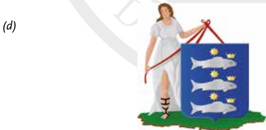
Afb. 12 Keurloden van Enkhuizen met op de voorzijde het stadswapen (drie haringen), diameter ca. 15 tot 21 mm. En met op de achterzijde de initialen PAF en het jaartal 1617, opgraving Paktuinen in Enkhuizen in 2014 (a); de initialen PH, opgraving Paktuinen in Enkhuizen in 2014 (b); de initialen II en het jaartal 1629, opgraving Paktuinen in Enkhuizen in 2014 (c) en het stadswapen van Enkhuizen (d).

men in de keurboeken. In het kader van dit artikel is dit niet voor al die plaatsen nagegaan. Achterhaald kan worden dat in ieder geval in Edam een keur is opgesteld: “dat niemant eenige buijsnetten sal mogen affleveren, directelijck noch indirectelijck, die in de jurisdictie deser stede sullen wesen gebreijt, voor ende alleer deselve netten bij Claes Moenssoon van Aeckswijck als geswooren looder daertoe gestelt, sullen wesen geloot” . 15